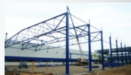
V marci 2011 sme ukončili zákazku pre spoločnosť IN VEST s.r.o. „Hala olepovania hrán – SWEDWOOD Trnava“...

Newsletter je nová služba, ktorá Vám poskytne aktuálne informácie o novinkách našej spoločnosti. Ak máte záujem o zasielanie našich noviniek, prosím zaregistrujte sa prostredníctvom uvedeného formuláru.