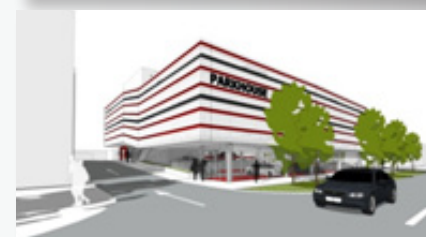
Najaktuálnejšia zákazka spoločnosti HESCON s.r.o. je „Parkovací dom TAVRIA Dunajská Streda“...

Partnerská zóna Vám umožní sledovať priebehy projektov, zasielanie a sťahovanie súborov priamo z našej kancelárie. Ak máte záujem zriadiť FTP prístup, zavolajte nám alebo napíšte na hescon@hescon.sk . Pošleme Vám prístupové heslo emailom.